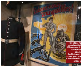
Sur l'échelle rouge, les résistants «coupables» d'actes de sabotage sont dépeints comme des «terroristes assoiffés non-français» et non des «libérateurs». Facile, la photo de leur déroute est exploitée, pour l'occasion, afin de dissuader d'éventuels Français à commettre d'autres actes de sabotage...