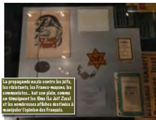
La propagande nazie contre les juifs, les résistants, les Français-maçons, les communistes... bat son plein, comme en témoignent les films (Le Jaff Zoua) et les nombreuses affiches des Nazis à manipuler l'opinion des Français.